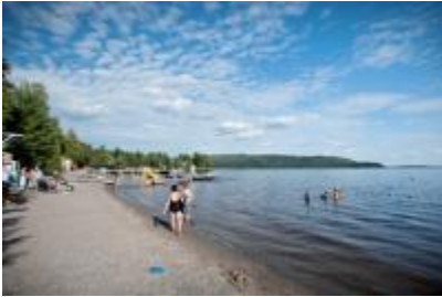
Lac Témiscamingue

Chaque Québécois a son lac préféré. En voici 10 magnifiques qui gagnent à être découverts.